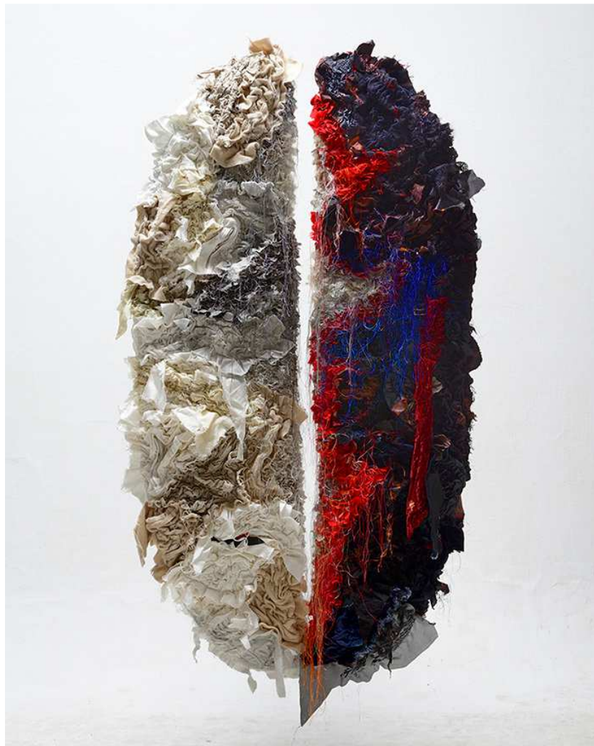
Cocoon 9 - Chiaki Dosho