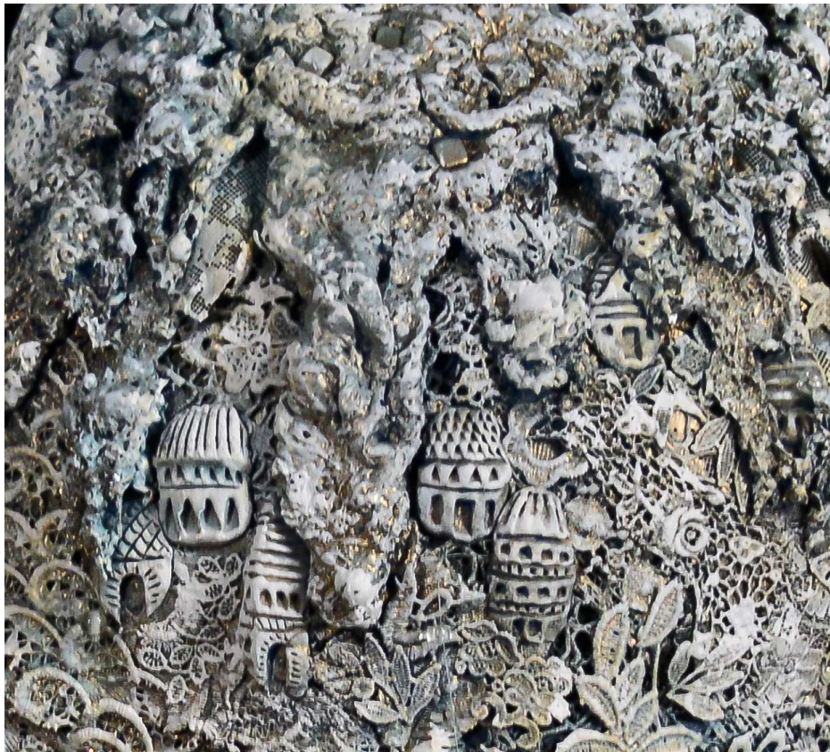
Les larmes de la Terre, Sylvie MAZEREAU