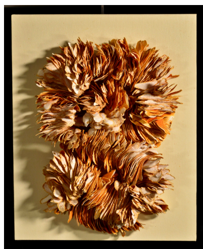
Orange 2 Ghislaine BERLIER-GARCIA