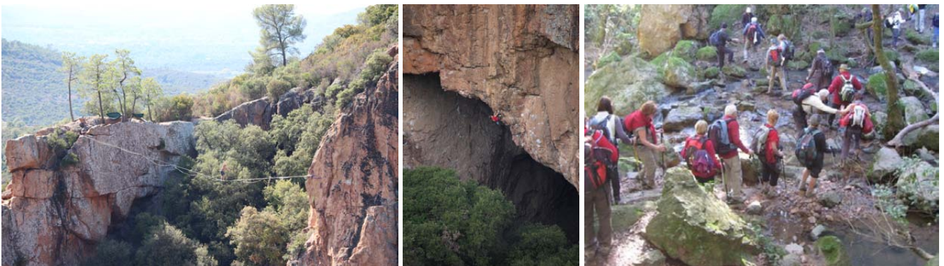
Photo 1. - highline, photo 2. - grimpeurs, photo 3. - marcheurs

La nette diminution de la fréquentation humaine pendant les confinements liés au COVID-19 semble expliquer la recolonisation de la grotte par le Murin à oreilles échan-crées. L'observation de cette colonie au même endroit en 2021, lors de la seconde période de confinement, puis son