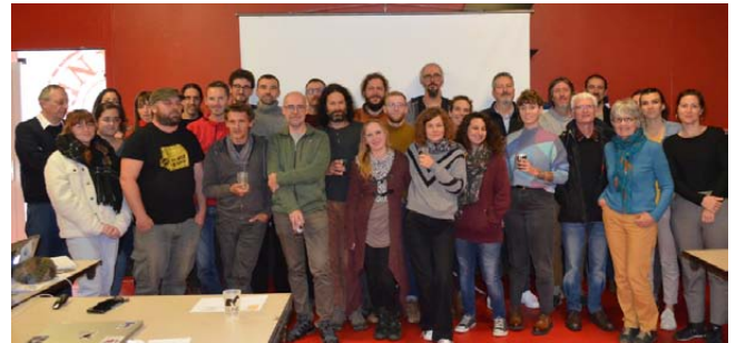
Les membres de la CCN regroupés à Bourges, décembre 2023