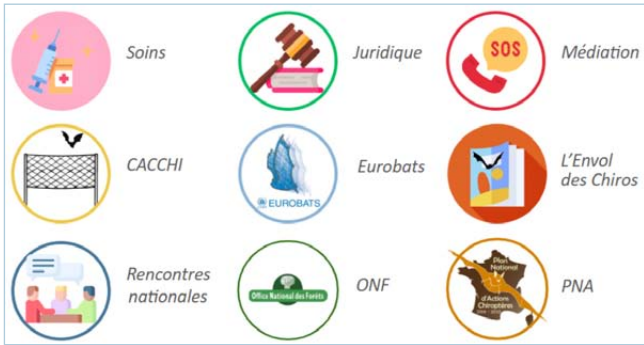
Liste des sujets sur lesquels un ou une référent(e) thématique est identifié(e) en 2024